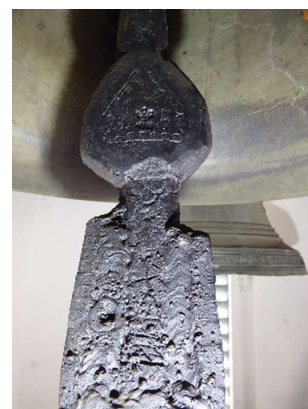
Alte Klöppel mit angeschweißtem Stahl; Fotos: Daniel Orth